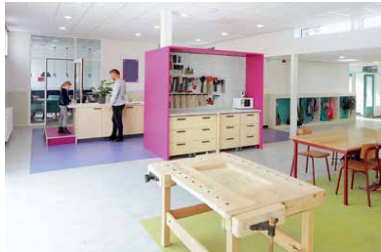
De kleurrijke maatwerkmeubels zorgen voor prettige werkplekken buiten de lokalen.