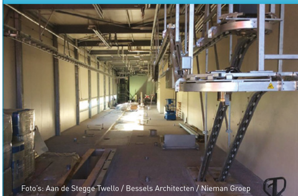
Foto's: Aan de Stegge Twello / Bessels Architecten / Nieman Groep