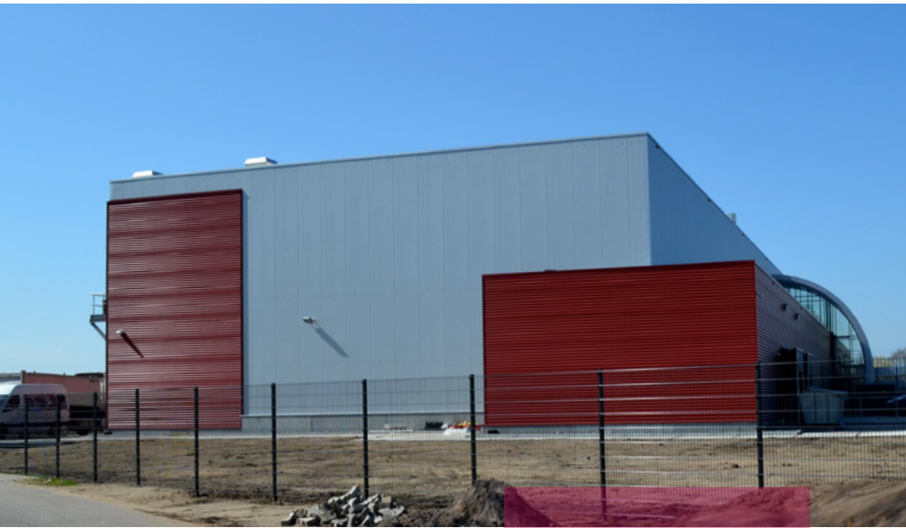
Oostgevel: gesloten, functioneel

ook wel, omdat er met ongeveer tachtig man tegelijk op een heel compacte bouwplaats wordt gewerkt. Om alle werkzaamheden zoveel mogelijk te stroomlijnen, is lean planning een noodzaak. Voor ons als aannemer is dat één van de grootste uitdagingen op dit project.'