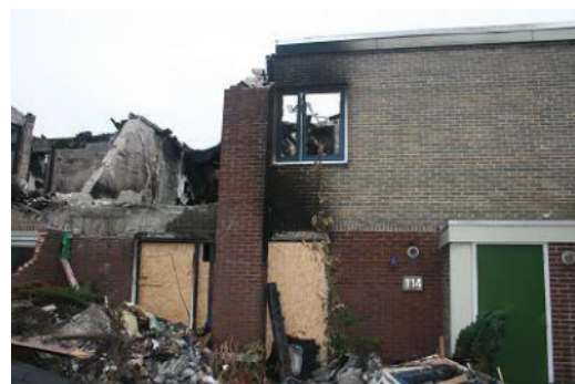
Foto's brand Hoofddorp

82 van de 102 woningcorporaties (80%) hebben gebouwen uit de risicocategorie in bezit en 20 woningcorporaties (20%) hebben dit niet.