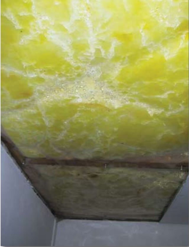
Afbeelding 2: Vochtschade kouddakconstructies door luchtlekken.

latendheid van de onderconstructie van zeer groot belang. Een klein luchtlek leidt in de praktijk al tot forse vochtschades door inwendige condensatie. Hiervan zijn helaas teveel ernstige voorbeelden (afbeelding 2). Iets meer aandacht in ontwerp en vooral in de uitvoering hadden de enorme schadeposten eenvoudig kunnen voorkomen.