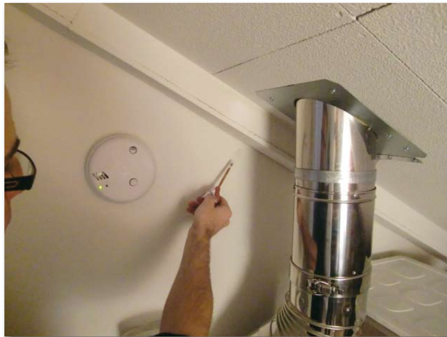
Afbeelding 3: Praktijkmeting.

Om te voorkomen dat men bij oplevering voor een voldongen feit komt te staan, geeft een tussentijdse globale controle van de luchtdichtheid halverwege het bouwproces veel praktisch inzicht en aandachtspunten voor de afbouw. De vraag naar inzicht in de eigen bouwkwaliiteit neemt bij ontwikkelde aannemers de laatste tijd ook toe. Meting van de luchtdoorlatendheid van de basis bouwkwaliiteit geeft veel inzicht in verbetermogelijkheden. Als na verloop van tijd blijkt dat een constante lage luchtdoorlatendheid wordt gerealiseerd, kan voortaan in de EPC-berekening (op basis van gelijkwaardigheid) worden gekozen voor een lage q_{v,10} -waarde, wat weer andere maatregelen uitspaart.